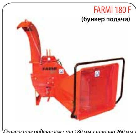
FARMИ 180 F (бункер подачи)

Отверстие подачи: высота 180 мм x ширина 260 мм