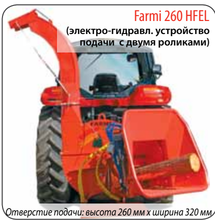
Farmi 260 HFEL (электро-гидравл. устройство подачи с двумя роликами)

Дисковый измельчитель 260 HFEL с грейферным загрузчиком является идеальной машиной для производства топливной щепы. В качестве основного материала используется чистое дерево, например, стволы, обработанные бревна или брус. Прекрасная подача обеспечивается верхним подающим роликом большого диаметра и подвижным качающимся роликом устройства подачи с двумя роликами. Мощные гидравлические двигатели и автоматическое управление системы подачи предоставляют оператору возможность полностью сосредоточиться на работе крана, тем самым обеспечивая значительный рост производительности и эффективности. Благодаря эффективному и прочному подающему конвейеру из стали измельчитель 260 HFC также подходит для измельчения веток и коротких кусков древесины. Более того, стальной подающий конвейер увеличивает скорость подачи длинных кусков дерева.