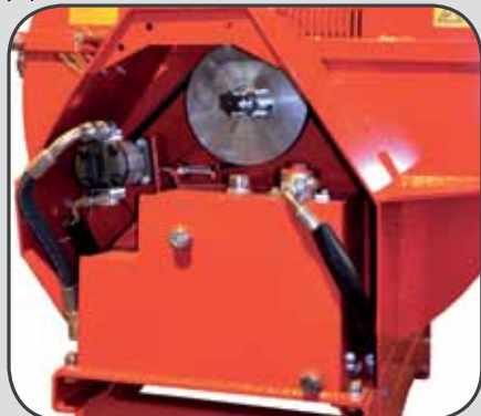
Гидравлический блок HD11