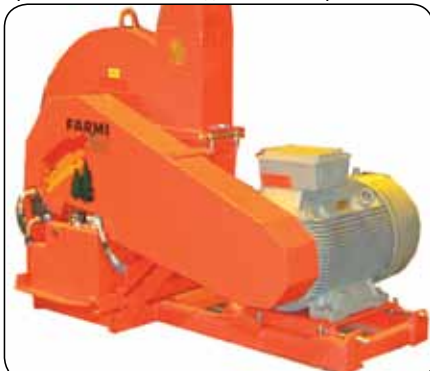
FARMИ260, оснащенный электродвигателем на монтажной базе SML232

Указанное далее опционное оборудование предлагается для моделей FARMИ 260 HFEL и HFC: собственный гидравлический блок (HD11), электрическая педаль управления устройством подачи и гидравлические функции поворота выпускной трубы, регулировка крышки выпускной трубы и открытие верхней камеры. При использовании отдельного опорного блока