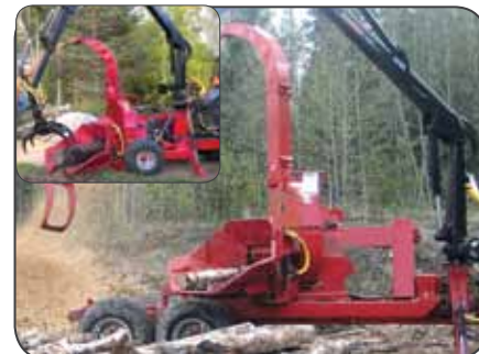
FARMИ 380 Устройство подачи с 2 или 4 дисками

В сочетании с краном FARMИ и подающим устройством FARMИ измельчитель FARMИ 380 предоставляет подрядчику возможность выполнения его работы на протяжении всего года при минимальных затратах. Более того, наши заказчики отмечают простоту и быстроту технического обслуживания, а также высокую производительность комбинированной машины и высокое качество произведенной щепы. Подающее устройство поставляется в комплекте с 2 или 4 дисками.