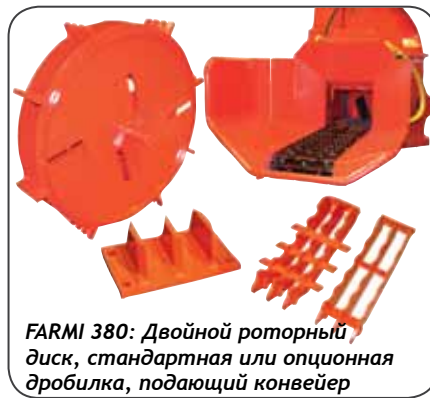
FARMИ 380: Двойной роторный диск, стандартная или опционная дробилка, подающий конвейер

Как правило, измельчители FARMИ 380 HF и HFC оснащены собственной гидравлической системой (1) , которая приводит в действие как устройство подачи, так и стандартный качающийся ролик верхнего подающего ролика (2) и управляет выпускной трубой (3) . Однако, гидравлическая система трактора используется для втягивания трубы в положение при транспортировке (4) и для открытия верхней камеры.