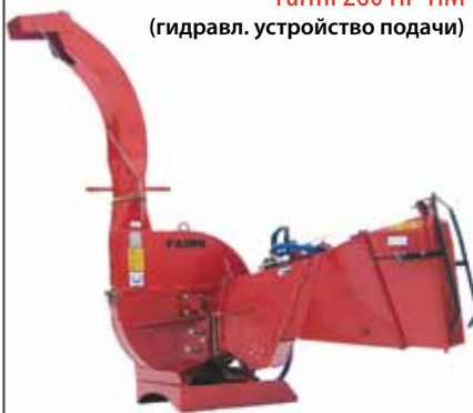
Farmi 260 HF-HM (гидравл. устройство подачи)

Отверстие подачи: высота 250 мм x ширина 300 мм