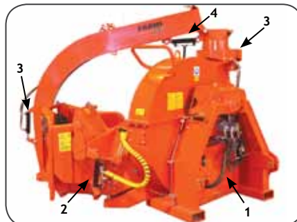
FARMИ 380 в положении транспортировки

Как правило, измельчители FARMИ 380 HF и HFC оснащены собственной гидравлической системой (1) , которая приводит в действие как устройство подачи, так и стандартный качающийся ролик верхнего подающего ролика (2) и управляет выпускной трубой (3) . Однако, гидравлическая система трактора используется для втягивания трубы в положение при транспортировке (4) и для открытия верхней камеры.