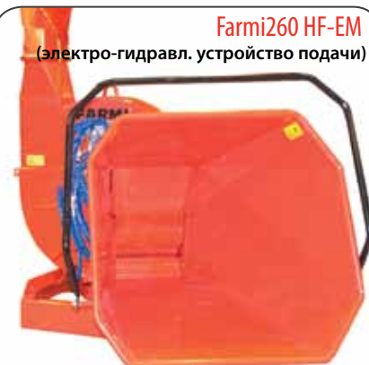
Farmi260 HF-EM (электро-гидравл. устройство подачи)

Отверстие подачи: высота 260 мм x ширина 320 мм