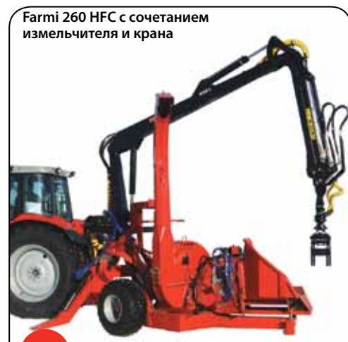
Farmi 260 HFC с сочетанием измельчителя и крана

Для измельчителей серии 260 имеется монтажное основание для прямого привода через электродвигатель (SML232). Если используется монтажное основание, то измельчитель может устанавливаться на одной монтажной площадке с электродвигателем.