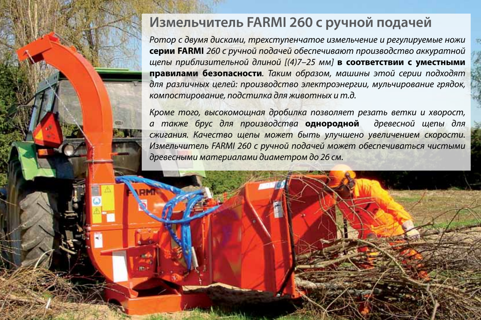
Farmi260 F (бункер подачи)

Кроме того, высокомогущая дробилка позволяет резать ветки и хворост, а также брус для производства однородной древесной щепы для сжигания. Качество щепы может быть улучшено увеличением скорости. Измельчитель FARMИ 260 с ручной подачей может обеспечиваться чистыми древесными материалами диаметром до 26 см.