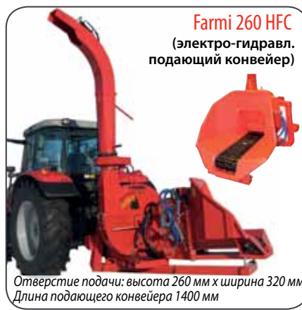
Farmi 260 HFC (электро-гидравл. подающий конвейер)

Отверстие подачи: высота 260 мм x ширина 320 мм Длина подающего конвейера 1400 мм