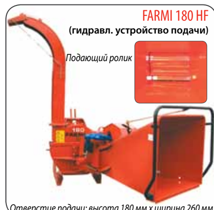
FARMИ 180 HF (гидравл. устройство подачи)

Как и FARMИ CH182HF модель FARMИ CH180 HF оснащена гидравлическим устройством подачи. Обе машины могут, как вариант, оснащаться собственным гидравлическим блоком (HD11).